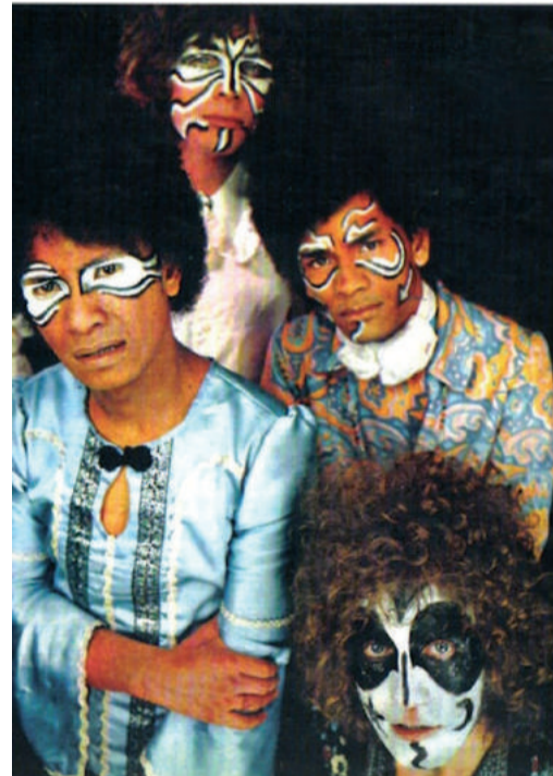
Hoes van de bootleg ep 4 celestial songs