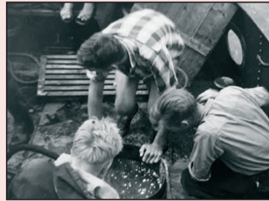
Zomerkamp