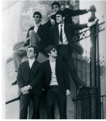
De band Creatures League liet gelikte foto's maken op de trap van de Nieuwe Kerk in Zierikzee