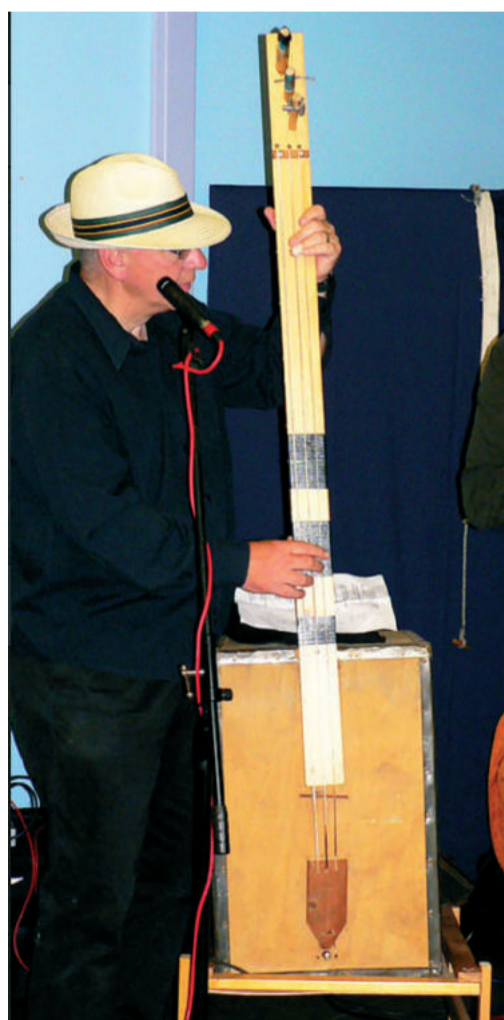
Een theekist als bas.