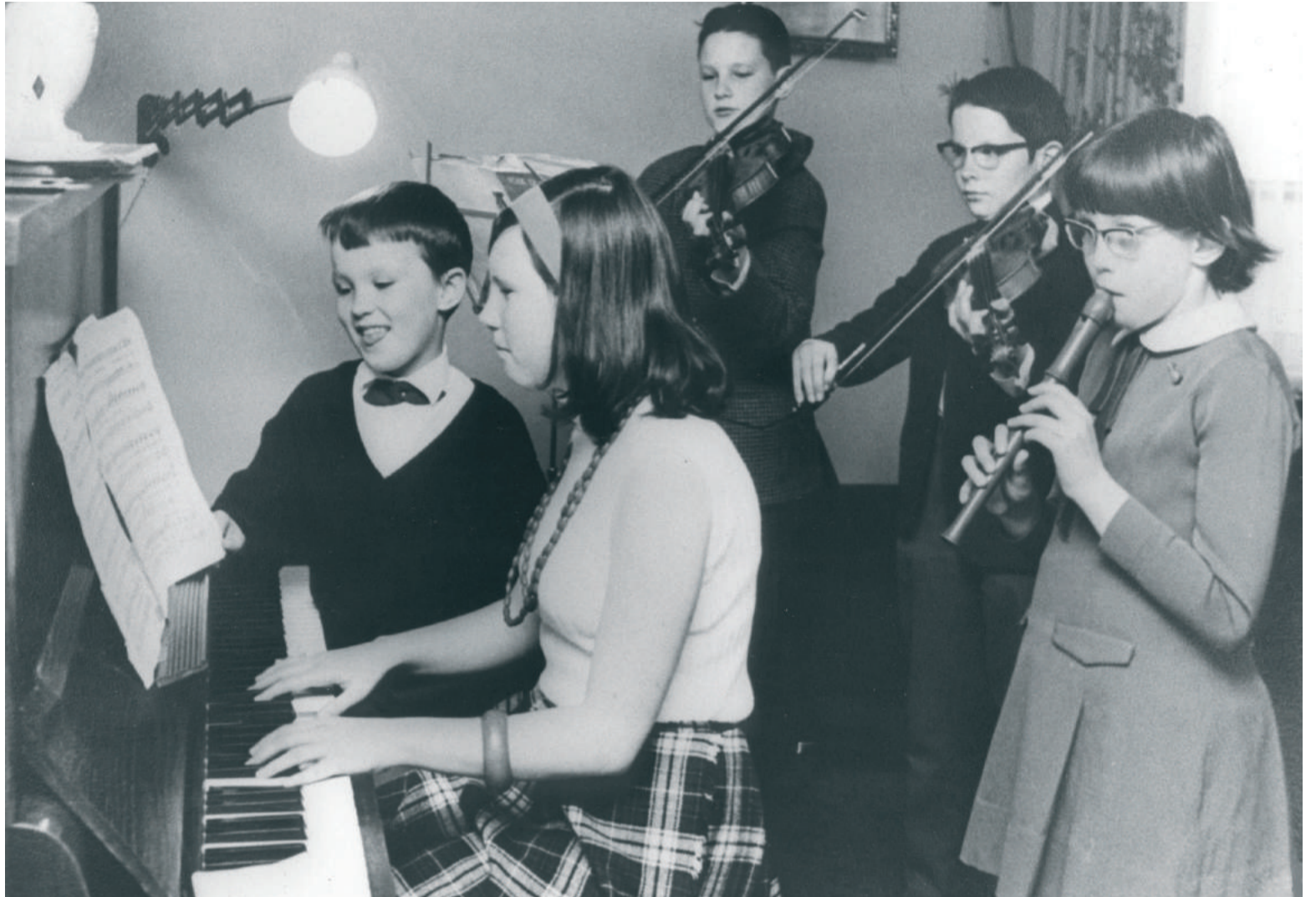
Ons huisorkestje in 1967: mijn zus bespeelt ditmaal de piano, twee broers spelen viool, ik had nog maar net pianoles en moest dus meedoen met de blokfluit, en mijn jongste broer mocht de bladzijden omslaan.